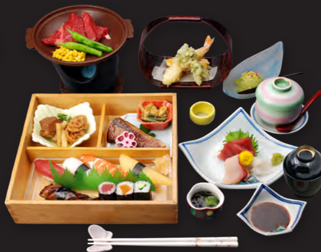
※写真は海の料理です。