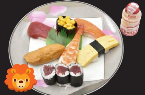
こども寿司 1,000円 (税込 1,080円)