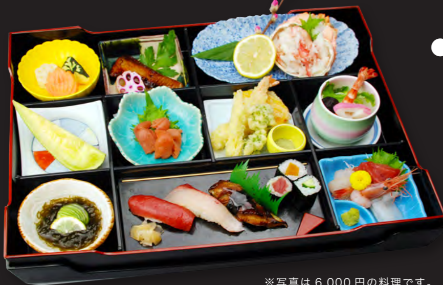
※写真は6,000円の料理です。