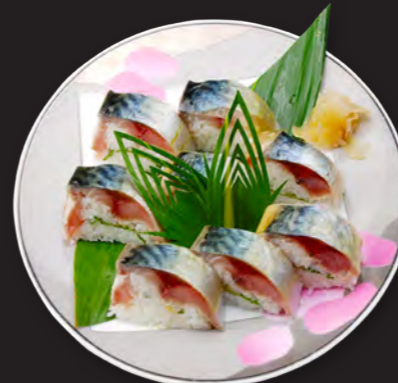
松前寿司 2,300円 (税込 2,484円)