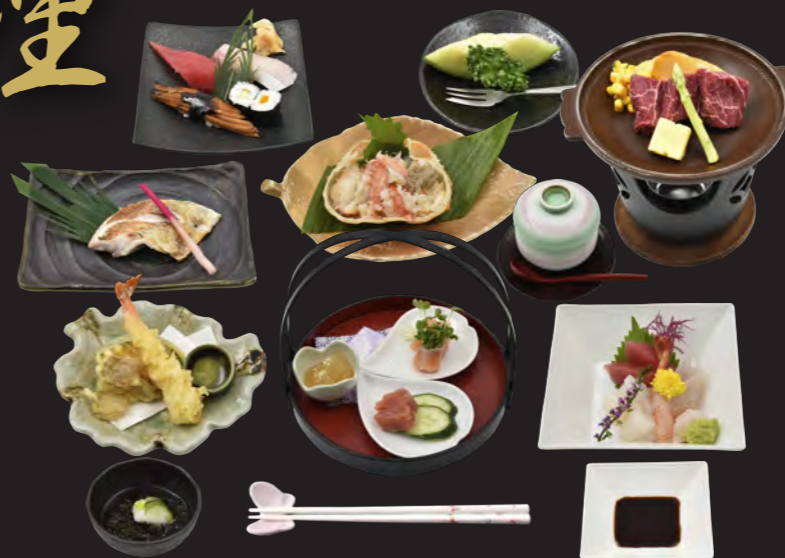
※写真は10,000円の料理です。