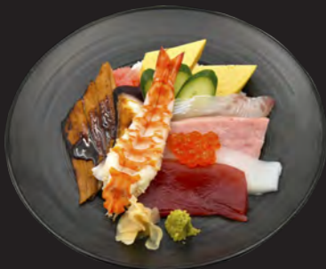
上ちらし 3,200円 (税込 3,456円)