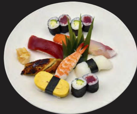
お寿司 1,400円 (税込 1,512円) まぐろ・サーモン・いか・かんぱち・えび 焼あなご・たまご・鉄火巻・かっぱ巻