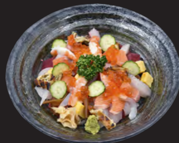
ばらちらし 2,300円 (税込 2,484円)