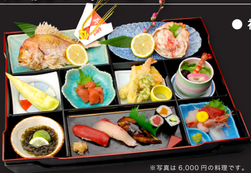
※写真は6,000円の料理です。