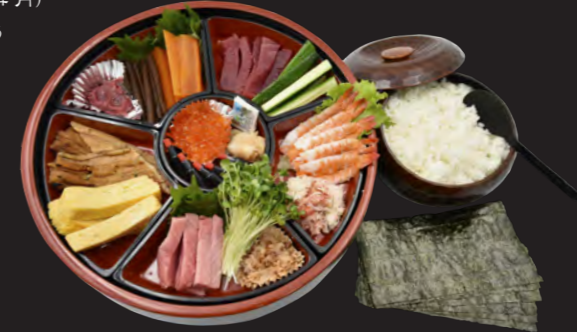
※写真は【上】のセットです。 手巻きセット (5人前) ※シャリ・のり付き 【並】 7,000円 (税込 7,560円) 【上】 13,000円 (税込 14,040円)