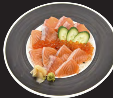
サーモンいくら丼 2,500円 (税込 2,700円)