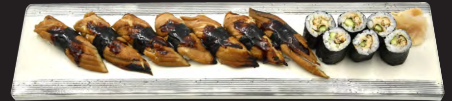
穴子づくし 3,300円 (税込 3,564円)