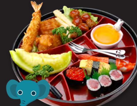
お子様スペシャル 2,000円 (税込 2,160円)