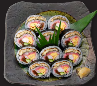
上巻 2,300円 (税込 2,484円) 焼あなご・たまご・えび・かんぴょう ぎゅうり・おぼろ