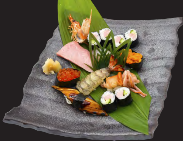
特上寿司 4,500円 (税込 4,860円) とろ・白身・赤貝・おどり・うに・いくら 焼あなご・とろぎゅう細巻