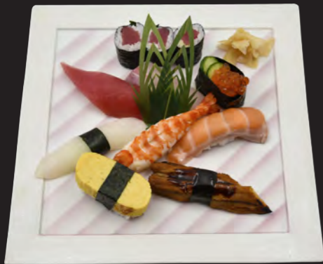
中寿司 2,400円 (税込 2,592円) まぐろ・白身・えび・いか・いくら・焼あなご たまご・サーモン・鉄火巻