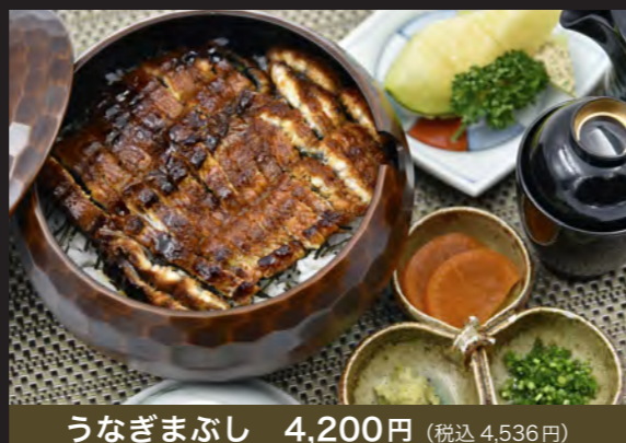
うなぎまぶし 4,200円 (税込 4,536円)