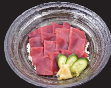
鉄火丼 2,500円 (税込 2,700円)