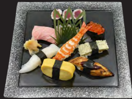
上寿司 3,200円 (税込 3,456円) とろ・白身・いくら・焼あなご・車えび 子持ち昆布・いか・たまご・鉄火巻