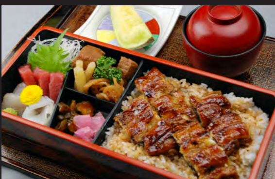
うなぎ定食 3,500円 (税込 3,780円)