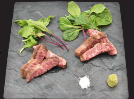
松坂牛 三角バラステーキ (A5 ランク希少価値部位) 3,500円 (税込 3,780円)